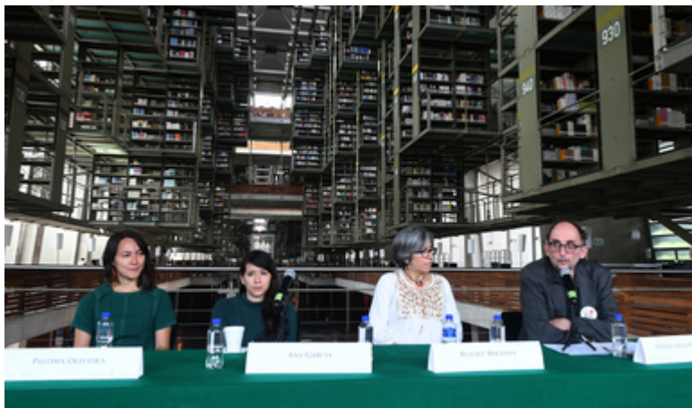
Abordan relación entre arte y “discapacidad” en coloquio internacional