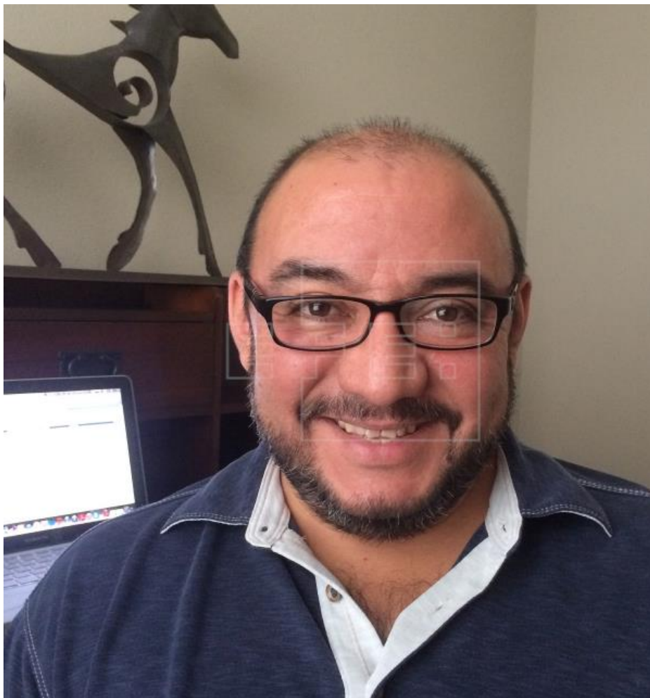
Fotografía cedida este viernes cortesía del filósofo político Sergio Villalobos Rumin Ciudad de México (México). EFE/Cortesía Sergio Villalobos/SOLO USO E