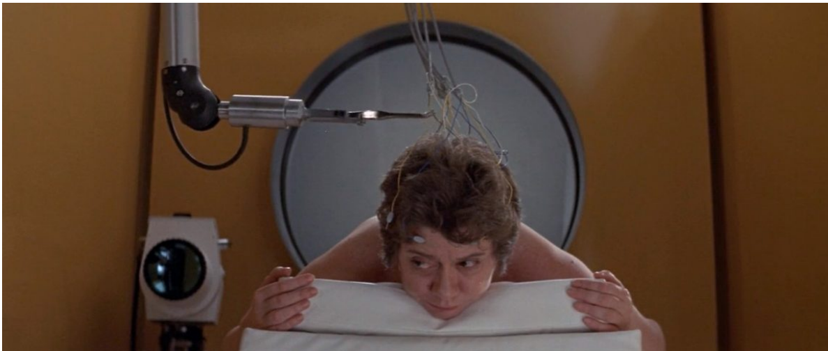
Fotograma de "The Andromeda Strain" (1971), director Robert Wise, Universal Pictures