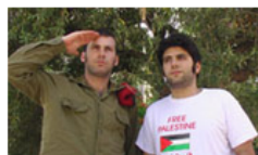
STATE OF SUSPENSION