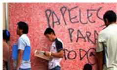
UN TRABAJO LIMPIO