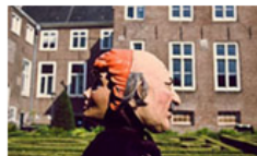
A LONG HISTORY OF MADNESS