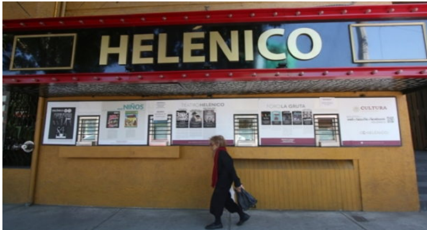
El Centro Cultural Helénico anuncia acciones clave para la continuidad de su plan de trabajo 2019